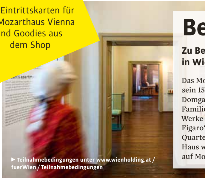
► Teilnahmebedingungen unter www.wienholding.at / fuerWien / Teilnahmebedingungen

FürWien verlost 3 x 2 Eintrittskarten. Dazu hat das Team des Museumsshops noch ein paar Goodies gepackt. Interessiert? Schicken Sie ein E-Mail (Betreff „Mozarthaus Vienna“) an zeitung@wienholding.at . Einsendeschluss: 31. 5. 21